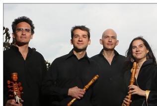
L'ensemble Résonances participe aux Journées du Patrimoine dans l'église du couvent Saint François @ NÉO TONY LEE

http://altamusica.org contact@altamusica.org